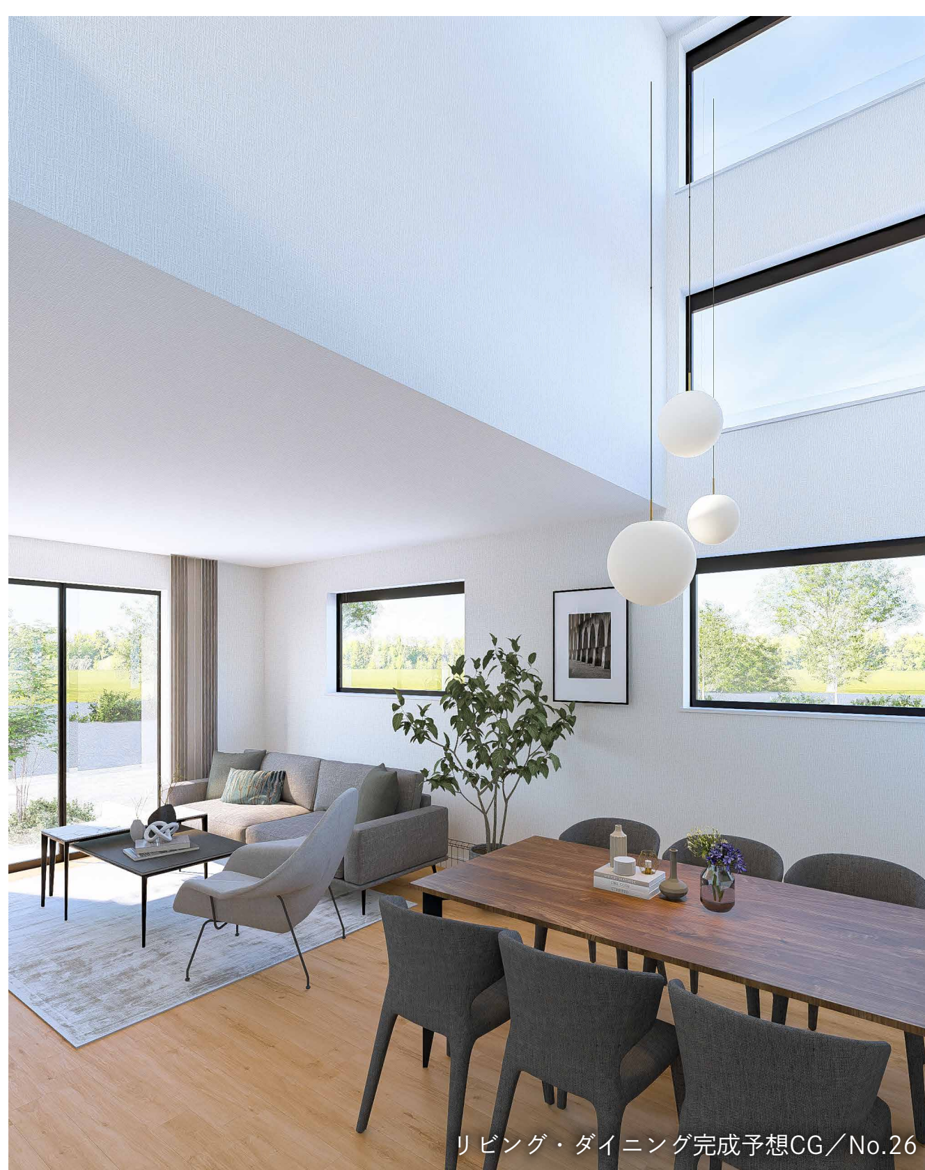
リビング・ダイニング完成予想CG/No.26