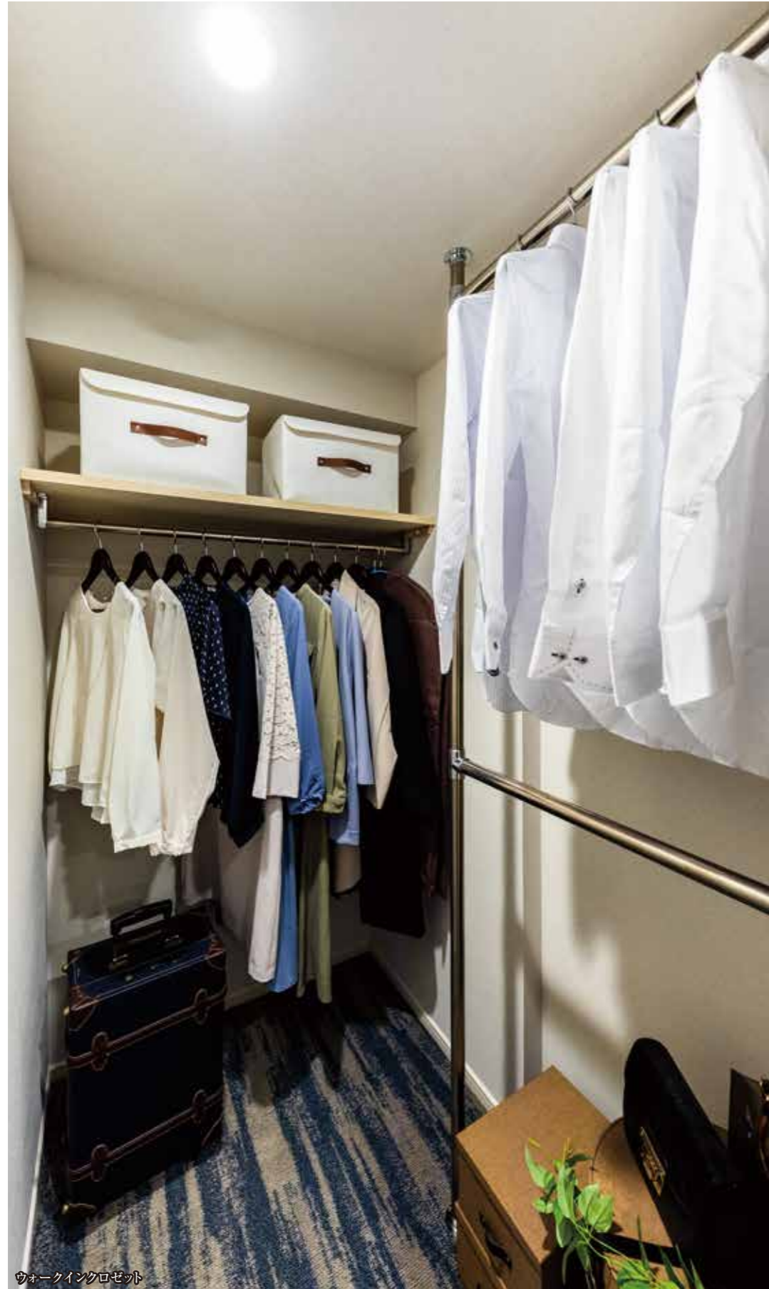
ウォークインクローゼット