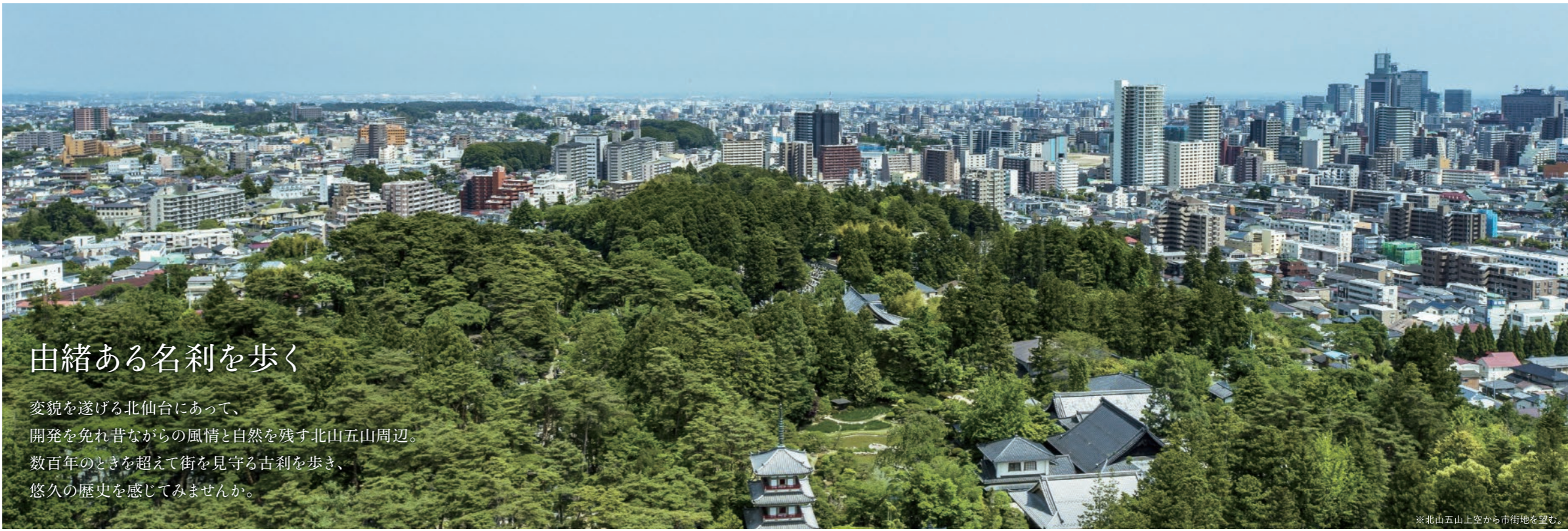
※北山五山上空から市街地を望む。