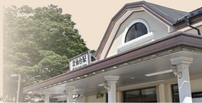
JR山線「北仙台」駅／徒歩2分(約120m)

いい店は地元っ子に聞くのが鉄則。 グルメスポットも多い北仙台界隈の、定番のお店と注目の新店を訪ねました。