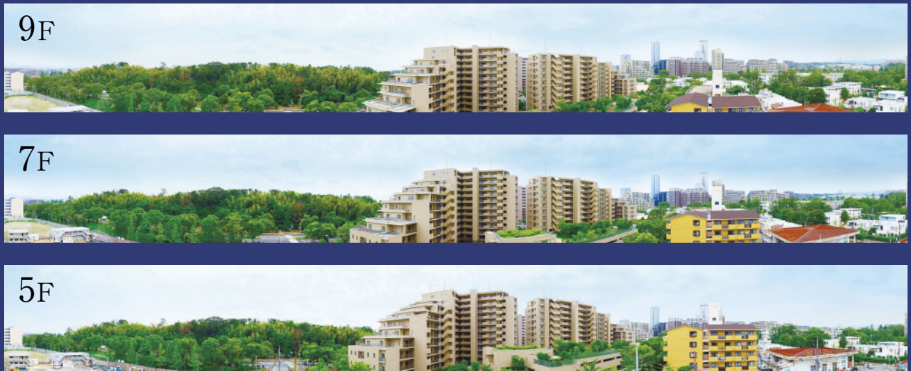
眺望写真 現地Iタイプから南方向を撮影 (2019年7月)

※眺望・景観は、各階・各住戸により異なり、今後周辺環境の変化に伴い将来にわたって保証されるものではありません。