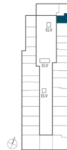
住戸位置概念図 10～15階