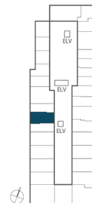
住戸位置概念図 7・8・12・13・15階