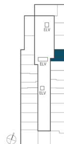
住戸位置概念図 16~19階