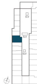
住戸位置概念図 11~15階