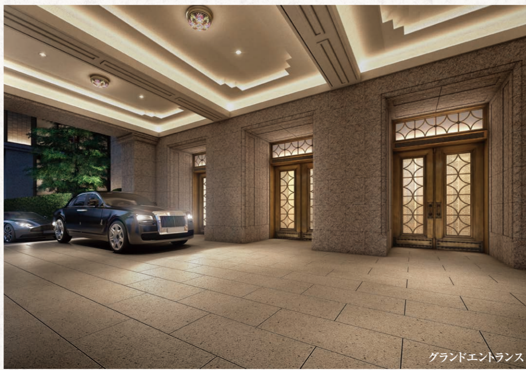
グラントエントランス

0 BIF 0 1F 0 2F 0 3F 0 4F 0 6F 配棟計画イメージイラスト