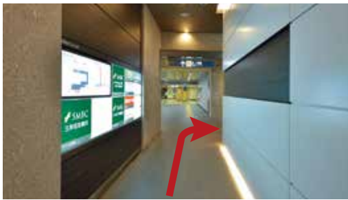
②電飾看板を通過し、右へ