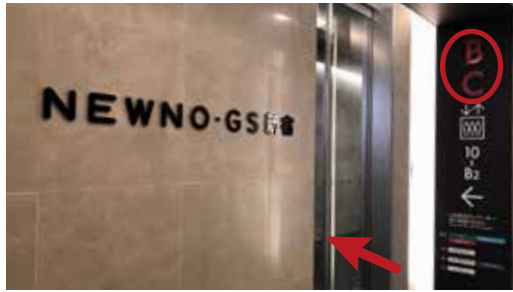
④突き当たりの「B」「C」エレベーター入り口へ