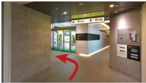
②三井住友銀行前で左(B12a方向)へ