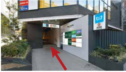
①東京メトロの看板に向かって入り口を直進、階段を下る