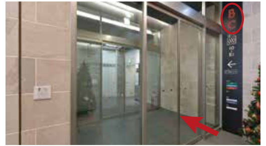
③突き当たりの「B」「C」エレベーター入り口へ