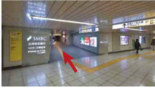
①B12a・B12b出口通路を直進