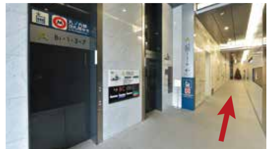
②「A」エレベーターの前を通過し、突き当たりまで直進