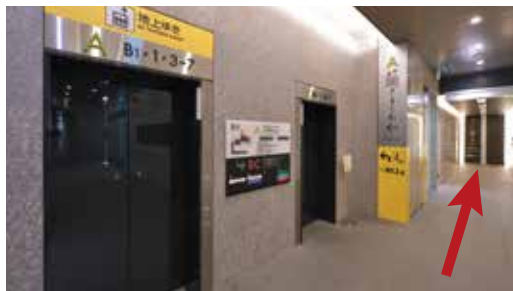
③「A」エレベーターの突き当たりを右へ