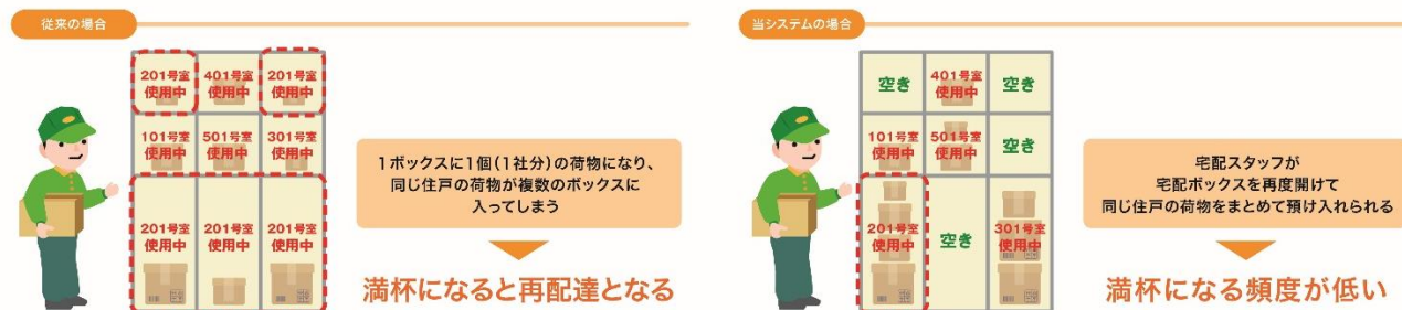
<宅配ボックス追加預け入れ概略図>

従来、1度の配達ごとに1つの宅配ボックスを使用していましたが、宅配ボックス使用中の住戸宛に後から届いた荷物を追加で同じボックスにまとめて入れられるよう、株式会社フルタイムシステムの宅配ボックスを改良。1つの宅配ボックスに多くの荷物を入れられることで、宅配ボックスの利用効率を上げ、満杯による再配達の手間を低減することができます。