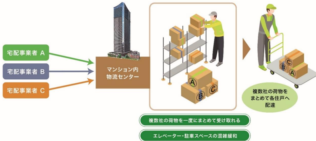
<宅配スタッフ常駐概略図>

※マンション共用部内に常駐し、各住戸へ配達業務等を行うスタッフ。宅配事業者への委託を想定しています。