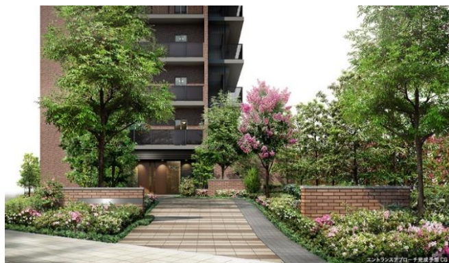
エントランスアプローチ完成予想CG