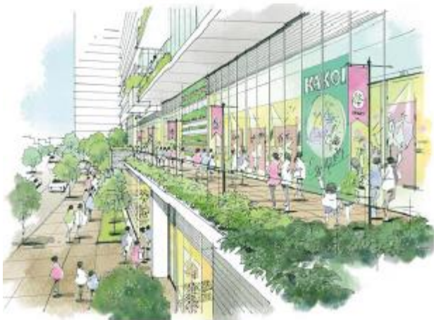
【2階デッキ商業イメージ】

約 1,000 m 2 の地区施設広場は、既存の区立「囲町ひろば」と空間的に連続して配置し、緑地による潤いと新たな賑わいを創出します。