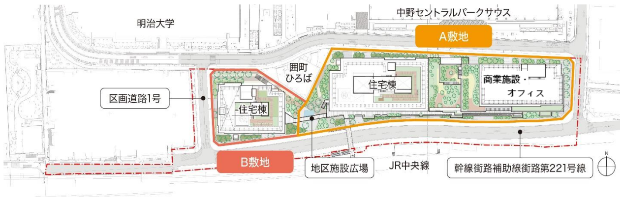
【施工区域図・建物配置図】