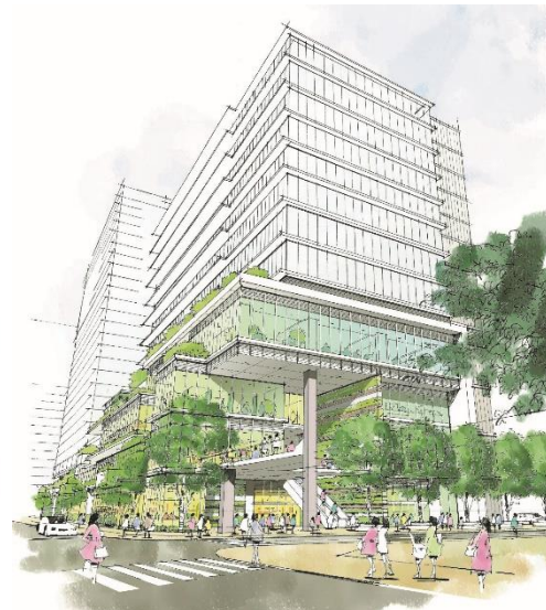
【1階中野駅前広場側商業イメージ】

駅から連なるペDESTリアンデッキを敷地内に延長し、デッキレベルの歩行者ネットワークを創出します。