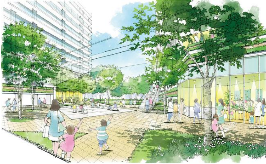
【1階地区施設広場のイメージ】

約 1,000 m 2 の地区施設広場は、既存の区立「囲町ひろば」と空間的に連続して配置し、緑地による潤いと新たな賑わいを創出します。