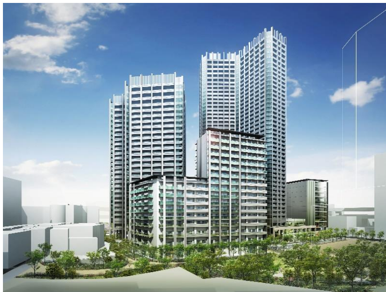
【建物外観完成予想CG】

今後も、権利者の皆様とともに、2027年の竣工を目指し事業を推進してまいります。