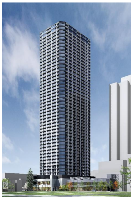
【建物外観完成予想 CG】

今後も、権利者の皆様とともに、2026年度の竣工を目指し事業を推進してまいります。