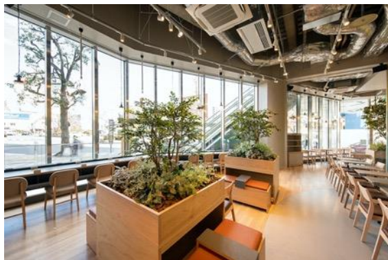
KOITTO TERRACE 内観 (2021年1月29日撮影)

JR小岩駅の開業から百余年の歴史を刻んできた小岩地区では、現在複数の大規模再開発事業が進行しています。まち全体が新しくなる中で、「まちとヒト」、「ヒトとヒト」をつなぎながら、地域をさらに盛り上げていくため、KOITTOが中心となり、官民地域連携のもと、公共的空間の管理・活用も視野に入れた、魅力あるエリア作りをオール小岩で進めていきます。初動期はコロナ禍の影響をうける地域を応援するため、オンラインイベント、テイクアウトマップづくりや販売場所の提供、テレワーク支援など、ニューノーマルな暮らしに寄り添ったエリアマネジメントを展開します。