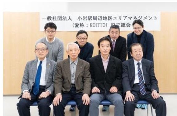
KOITTO 役員及び正会員代表者 (2020年11月16日設立総会にて撮影)