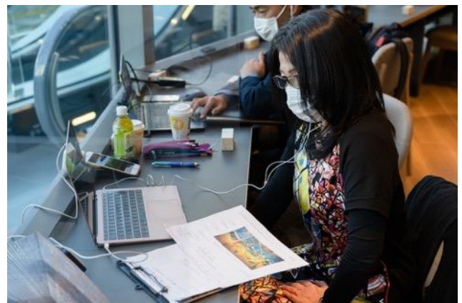
店内アートを担当された方にもゲストとして参加。 アートに込めた想いも参加者に紹介されました。