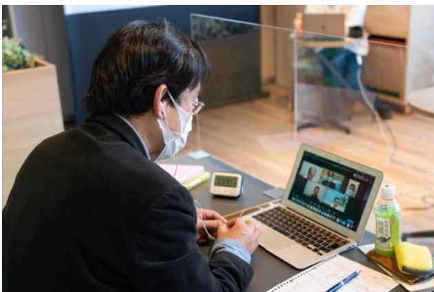
後半では小部屋に分かれて交流会を実施。 各グループごとに活発な意見交換が行われました。