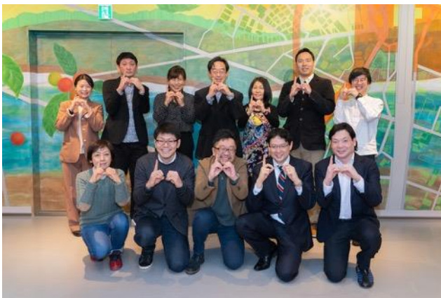
トークゲスト・運営メンバー 集合写真。 (撮影のためマスクを外しています。)

1 月 30 日に KOITTO TERRACE のオープンを記念して、住民有志によるオンラインイベントが開催されました。まちで働く 100 人を起点に人と人をつなげる「江戸川区 100 人カイギ」のゲストトークの配信会場として KOITTO TERRACE が利用され、総勢 42 名(オンライン)の方が参加しました。ゲストのまちに対する熱い想いに触れながら、参加者同士の交流が深まり、今後のまち運営に対する期待が膨らむイベントとなりました。