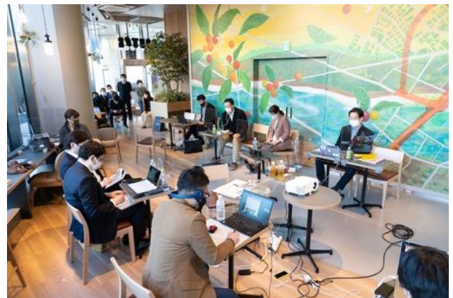
オンラインイベント中の様子。 オンライン会議にも対応できるよう無線 wifi も完備。